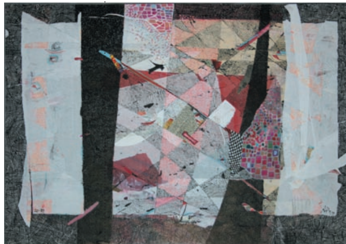
1 Gert Weber Todesmarsch Öl auf Leinwand